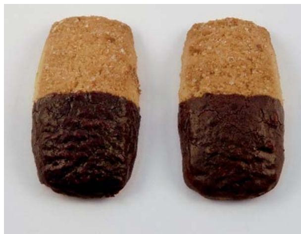
FIGURA 1 - Galletitas recubiertas con un baño de repostería con leche amargo tradicional (derecha) y reducido en grasa (izquierda) por medio de la técnica por inmersión (dipping).

El baño de repostería reducido en grasa se elaboró con 20% p/p de cacao amargo desgrasado en polvo (Joaquin Cutchet e Hijos S.R.L., Santa Fe, Argentina), 15% p/p de leche en polvo descremada (SanCor Coop. Unidas Ltda., Santa Fe, Argentina), 10% p/p de azúcar impalpable (Borgato y Pirola S.R.L., Santa Fe, Argentina), 3% p/p de proteína del lactosuero en polvo como sustituto de grasa (Simplese Dry100, CPKelco US Inc., Atlanta, USA), 1% p/p de glicerina como plastificante (Cirse S.R.L., Buenos Aires, Argentina) y agua potable. Además, se elaboró un baño de repostería tradicional (usado como control) utilizando los mismos ingredientes, pero reemplazando el contenido de sustituto de grasa por 5% p/p de aceite de girasol (Aceitera General Deheza S.A., Córdoba, Argentina) y 1% de lecitina de soja líquida como emulsionante (Yeruti S.R.L.,